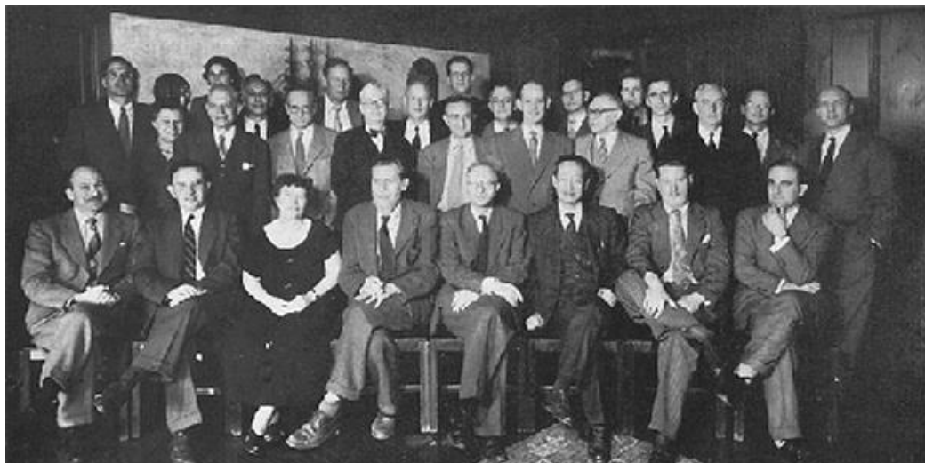
Participants aux Conférences Macy, 1953